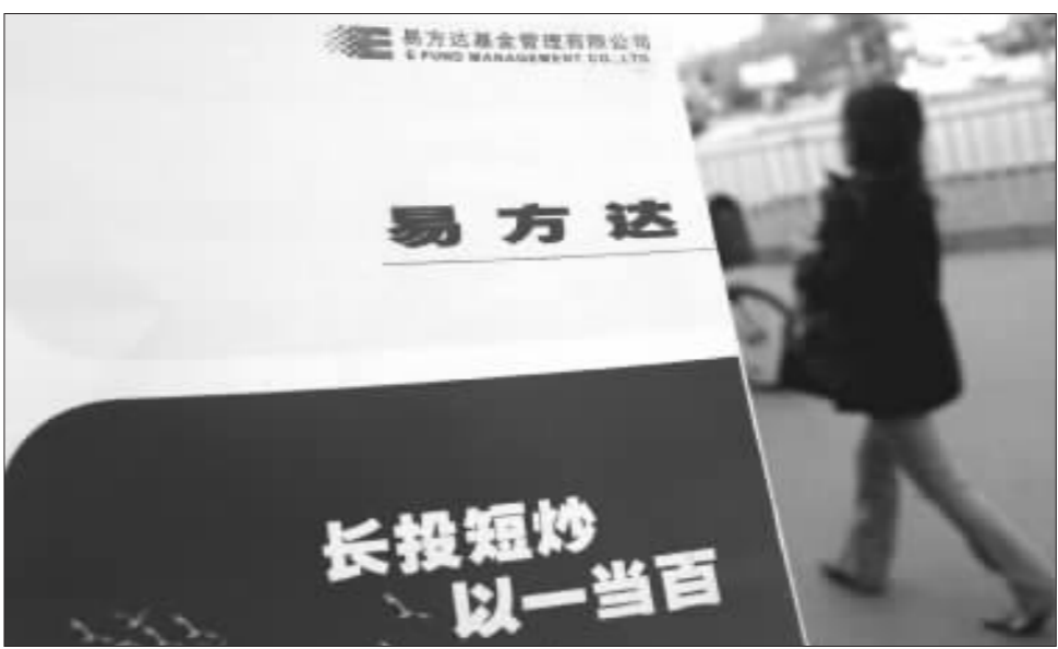
在市场向好的大环境下,绩优基金受到投资者的青睐

聚源数据研究所的统计数据显示,股票类开放式基金在2季度跑赢了大盘。聚源数据研究所在对2006年前发行的124家股票类开放式基金累计净值增长率统计后发现,该指标2季度平均值为31.7%。