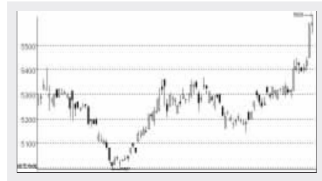
豆油期货主力日K线图 张大为制图

向空头。连豆以及连粕均出现下落。而大连豆油期货则延续了前日的强势,主要合约收盘再次创出新高。昨日豆油主力609合约收盘5510元/吨,大涨116点,其收盘价也是当日最高