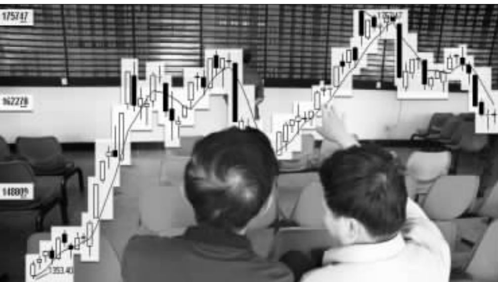
大盘调整之后恰是投资者拾取廉价优质筹码的良机 张大伟制图