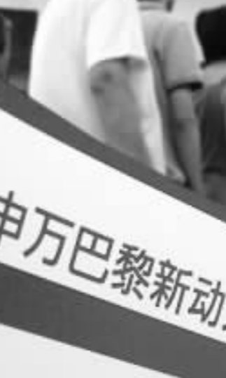
基金越来越吸引广大投资者青睐 资料图

择老基金的好处有以下几个方面的原因,一个是在市场向上走的时候,新基金建仓会产生较大的冲击成本。也就是说新基金要构建同老基金一样的投资组合,恐怕无法以同样的价格拿到足够的筹码,同时新基金在建仓的过程中还可能将价格进一步推高,使成本继续增加。