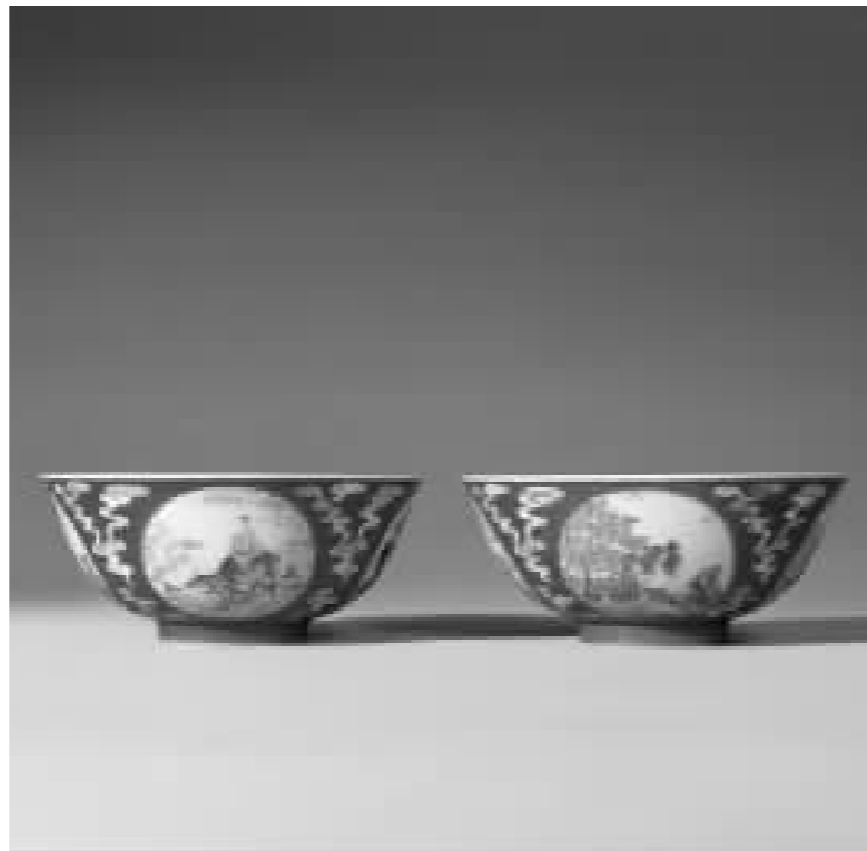
清道光 蓝地粉彩锦地灵芝纹开光式《牛郎织女》图盘 (一对)

这一对大清道光年制的图盘,碗形端正,碗心绘清华牛郎织女相会于鹊桥之上,外壁则在粉彩地上