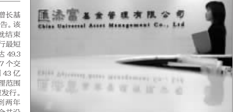
汇添富已成为中国基金业一股不可忽视的新锐力量