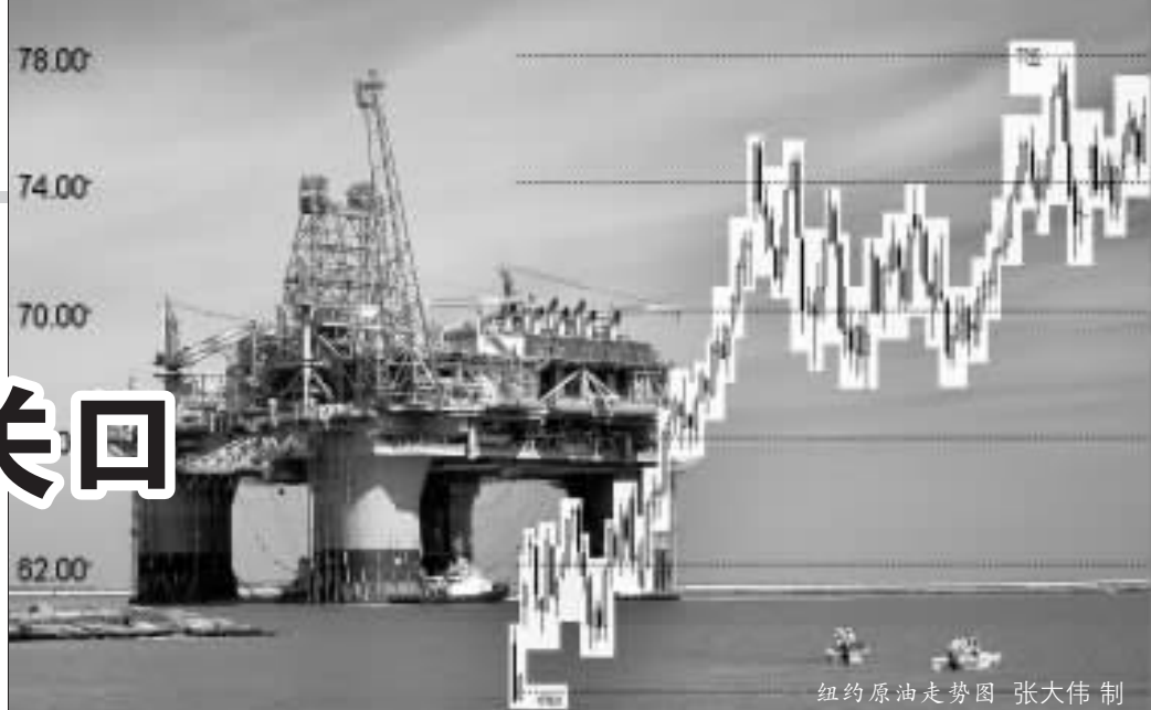
纽约原油走势图 张大伟 制

无缓和的迹象,而且全球原油需求不断上扬,业内人士预计国际油价短期内还将继续上扬。上海燃料油市场昨日在买盘的帮助下盘中走高,各合约收盘涨幅在35至96点间,其中主力0610合约收报3677元/吨,涨53元。全日成交8.5万手,持仓量为5.21万手,增加4186手。