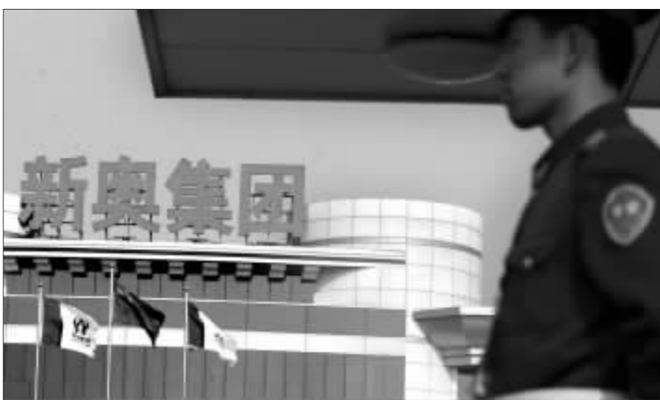
新奥集团是中国目前最大的民营燃气企业 资料图

这一策略的调整,意味着新奥燃气将与此前布局中国燃气市场的能源巨头中华煤气、中国燃气控股有限公司以及百江燃气控股有限公司在中型以上城市展开正面竞争。目前,新奥燃气在长三角地区已经进入十多个城市,在珠三角则只进入七八个城市。