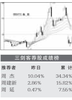
三剑客荐股成绩单

论释公司基本面脱胎换骨股的积极变化,其未来的报复性井喷行情随时可能爆发。该股近期在大盘调整中,表现极为抗跌,主力资金积极运作迹象十分明显。近期在调整至前期低点得到有效支撑后,昨日更是借助大盘上涨的东风强势拉升涨停,这无疑预示着该股的新一轮主升浪已经展开,建议逢低关注。