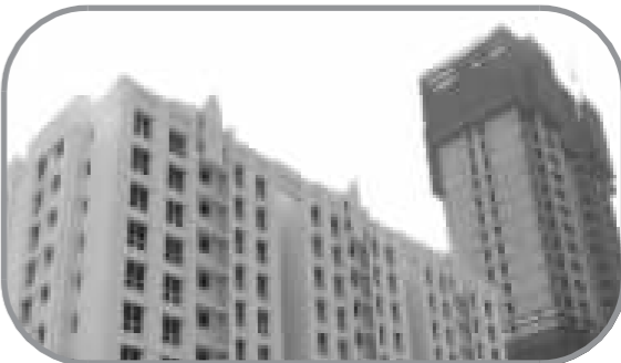
A 翠湖天地御苑 所处位置 卢湾区内环以内 本周成交均价 50177.8元/平方米 上周成交均价 49977.9元/平方米 升降幅度 +4.00%

7天之中,上海外郊环间区域的住宅成交量为989套,为“四环五区域”中成交量最为集中区域,上海全市的住宅成交量为36.5万平方米,与上周基本持平,全市一周的住宅供应量则稳定在23万平方米左右。从公寓的成交量来分析,上海全市的公寓成交量已连续8周稳定在20-25万平方米之间。一周之中,上海公寓市场共去化22.11万平方米,环比下跌了9.7%。从上海全市的板块成交结构来看,由于上海康城的乐观销售业绩,闵行区莘庄板块被带动成为全市板块成交首位。从环线成交情况来看,中外环间区域的成交情况有明显增长。究其原因,主要是由于宝山区的和欣国际花园、美岸华庭等各楼盘热销明显,在此销售情况带动下,本周中外环间区域的成交套数环比增长53套,成交均价上涨了171元/平方米。