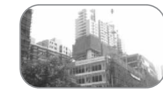
D 永新城 所处位置 徐汇区内环以内 本周成交均价 24510元/平方米 上周成交均价 24509元/平方米 升降幅度 0.00%