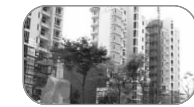
C 万里大华偷景华庭 所处位置 普陀区内环内 本周成交均价 8065.5元/平方米 上周成交均价 8332.1元/平方米 升降幅度 -3.2%