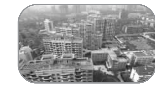
B 瑞虹新城二期 所处位置 虹口区内环以内 本周成交均价 15864.8元/平方米 上周成交均价 16221.7元/平方米 升降幅度 -2.20%