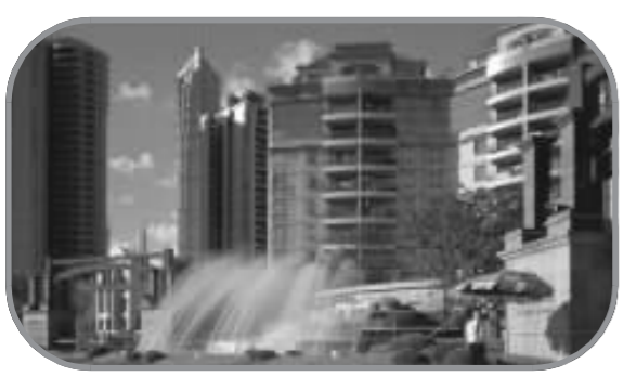
E 仁恒河滨城 所处位置 浦东新区内环以内 本周成交均价 17052元/平方米 上周成交均价 15266元/平方米 升降幅度 +11.70%