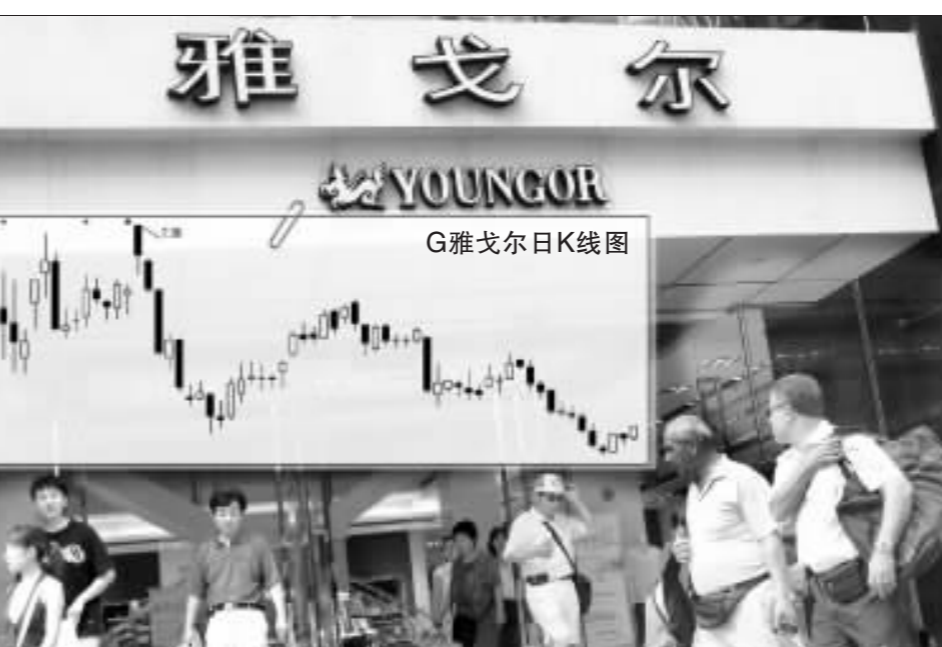
作为小市值行业流通市值最大的雅戈尔,其流通市值也没有超过50亿元 张大伟 制图

如果进一步分析减仓行业的业绩变化,可以发现,电力行业2005年末平均每股收益为0.1269元,业绩增幅为负41.11%。