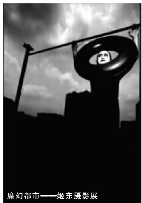
魔幻都市——姬东摄影展

本次展览,贵在发掘新人。在油画市场持续高温的情况下,您将会有全新的视觉和精神感受,这无疑将是一股清凉的泉,给您更为宁静的思考空间。