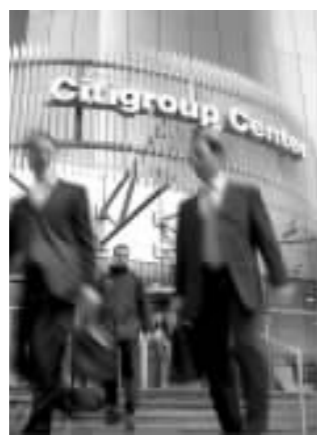
多家投行将公布清淡业绩