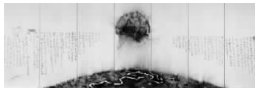
蔡国强《为人类所作的计划第2号》