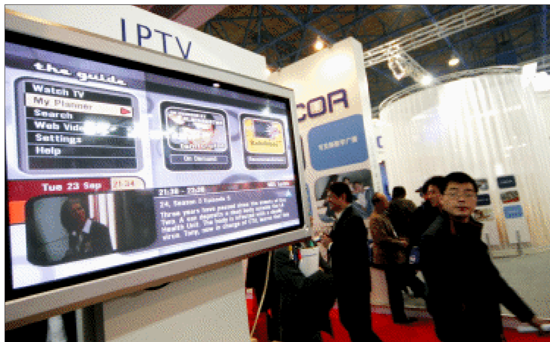
IPTV牌照成为传媒业打开未来之门的钥匙 资料图

据了解,广东电信的IPTV试点在2004年就已开始,也是全国最早的试点区域之一。而从去年年底的招标情况来看,华为承建广州