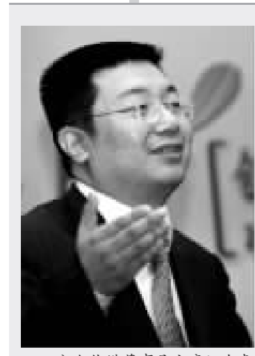
分众传媒董事局主席江南春