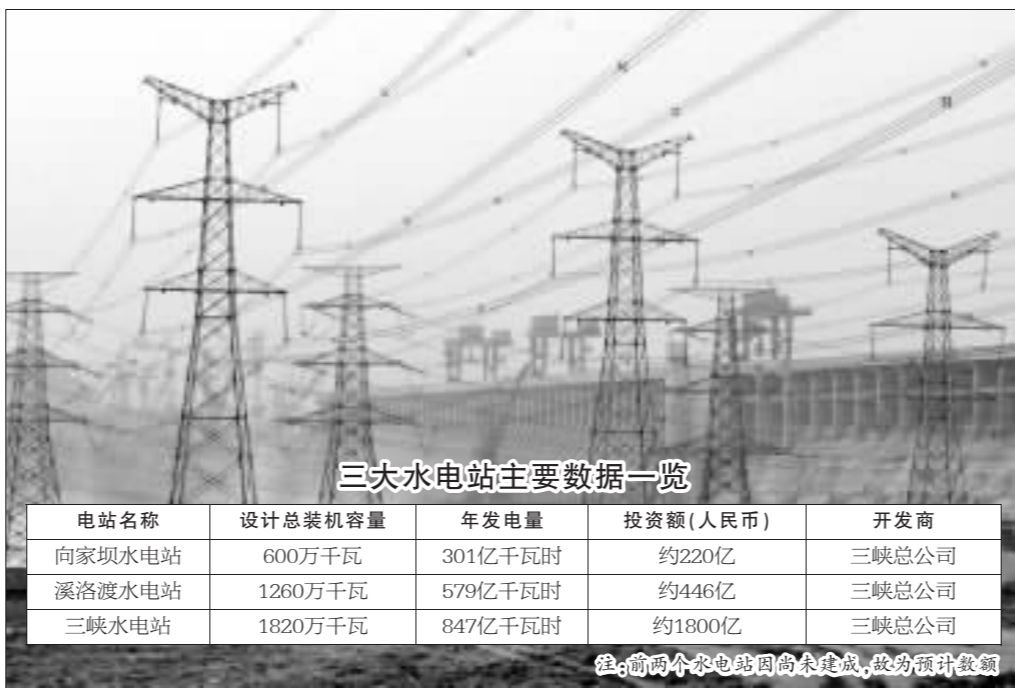
三大水电站主要数据一览

水电建设前期投资特别大,每千瓦约8000元。但三峡公司葛洲坝和三峡两个电站装机容量2511万千瓦,按2005年水电设备利用小时数3600小时/千瓦,上网电价0.25元/度计,若机组全部投产运转,每年收入可达225.99亿元。这些资金足够滚动开发。