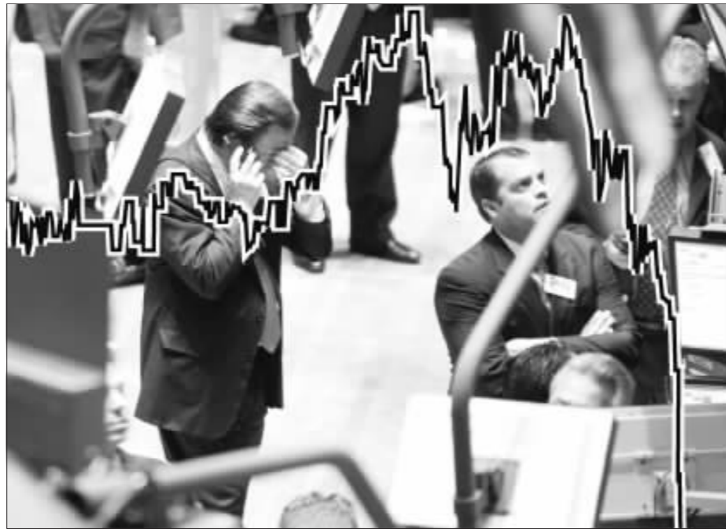
纽约原油期货昨日走势 张大伟 制图

由于隔夜国际油价大幅下调,国内带有能源属性的商品期货价格集体“跳水”。郑州白糖期货再度创出新低,沪燃料