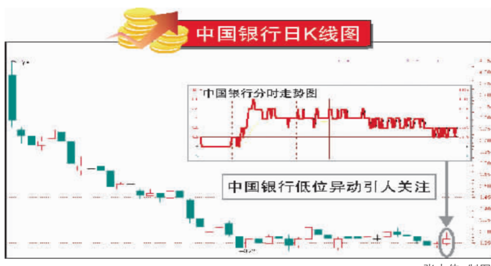
中国银行日K线图 张大伟 制图

从近期盘面来看,不难发现以下几个突出的特征:一是权重股对市场起到决定性的主导作用。从8月28日大盘突破多空成本线以来,最明显的两个板块——银行股和地产股崛起带动了大盘的拉升,而这两个板块的关键角色正是招商银行和万科,这两个领头羊对市场的支撑和带动作用相当明显。当然,其上涨的背景也是非常明确的,招商银行在香港发行H股受到热情追捧;而人民币升值步伐的加快对地产股前期利空有了一个缓冲,万科领头上扬也提振了人气。在这两个领头羊的带动下,金融板块和地产板块的整体性行情也悄然展开,金融和地产都是大市值和权重较大的板块,资金的推动形成比较明显的多头凝聚效应。 第二个特征就是权重股