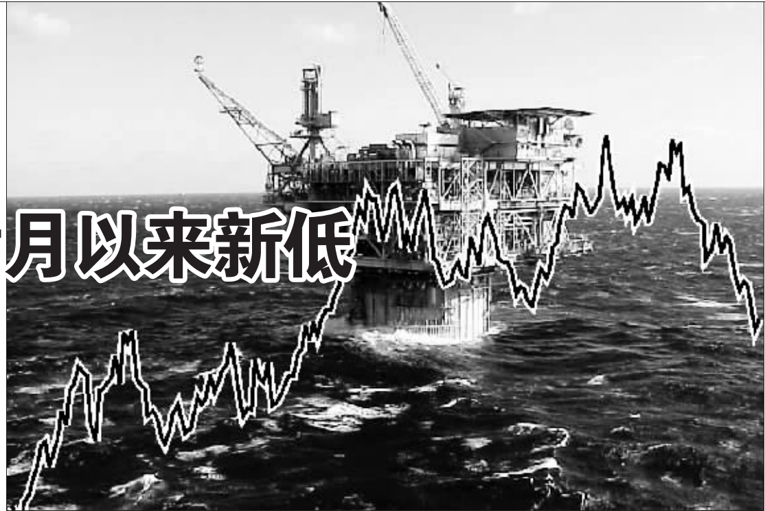
伦敦布伦特原油主力走势图 张大伟 制图