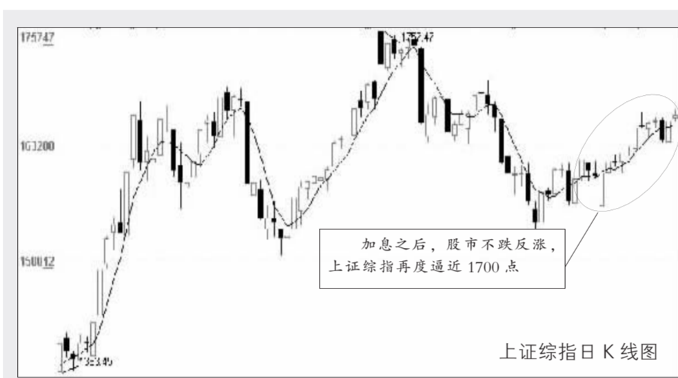
上证综指日 K 线图

第二张底牌是工商银行的发行上市。有消息称,工行 A 股发行规模将减磅。市场预期近期走势将相对稳定,以便为工商银行的发行与上市营造“祥和”的气氛。9 月份新股扩容节奏已明显放