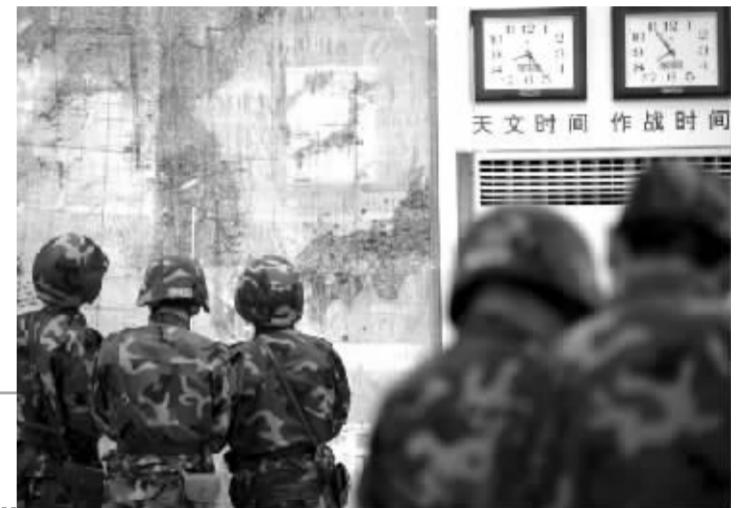
沈阳军区某机械化步兵旅首长机关在演练指挥中心作业

六看士气素养。这次参演部队,是陆军中的精锐部队,代表了解放军陆军机械化部队的发展水平,他们的作战士气、技战术素养,必将给人们留下深刻的印象。