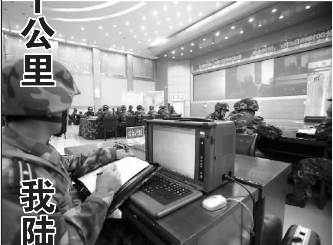
沈阳军区某机械化步兵旅一名参演人员在进行文书作业

几所指挥院校、有关军区合同战术训练基地的50余名专家组成,将运用“部队演习评估系统”,对机械化步兵旅“指挥控制、远程机动、火力打击、整体防护、综合保障”五种能力进行全面检验和综合评估考核。