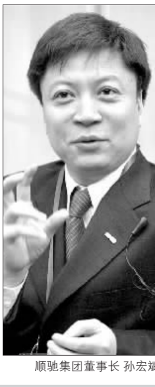
顺驰集团董事长孙宏斌