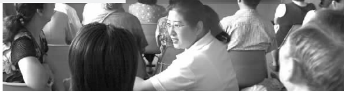
万众瞩目的中石化“王者归来”,带给大盘的不是强势冲关,反而是冲高回落 张大伟 制图

外,周四盘中热点乏善可陈,地产、有色、金融、钢铁等板块均无太大建树,权重股多数也呈震荡下跌走势,对大盘负面影响明显。