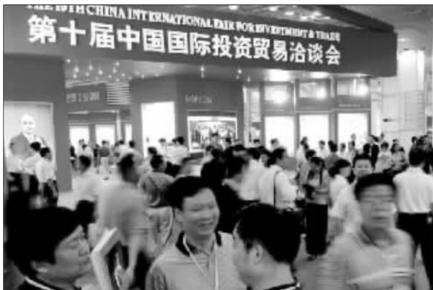
第十届中国国际投资贸易洽谈会昨日在厦门开幕

上解决上述问题,必须认真贯彻落实科学发展观,切实转变经济增长方式,内外兼修,采取综合性的治理措施。从内部看,近期要根据形势变化,进一步加强和改善宏观调控,加快推进政府行政