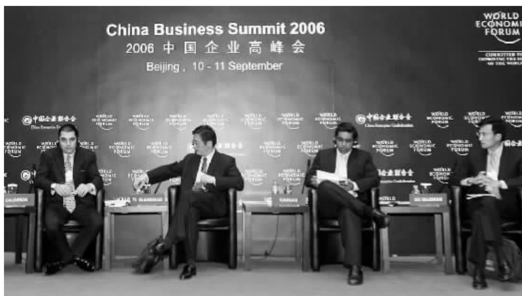
资本市场分论坛昨日召开。左二为中国证监会副主席屠光绍

针对当前资本市场发展的环境,屠光绍表示,无论从国内还是国际环境来看,对我国资本市场的发展都十分有利。从国内来看,正在进行的企业体制改革和整个经济体制改革的深化都将推动国内资本市场的进一步发展。另一方面,目前国内的居民储蓄率很高,这也为资本市场的发展创造了良好条件;从国际环境来看,中国经济的发展越来越与世界经济的发展融为一体,这也为中国的资本市场发展提供很好的外部环境。