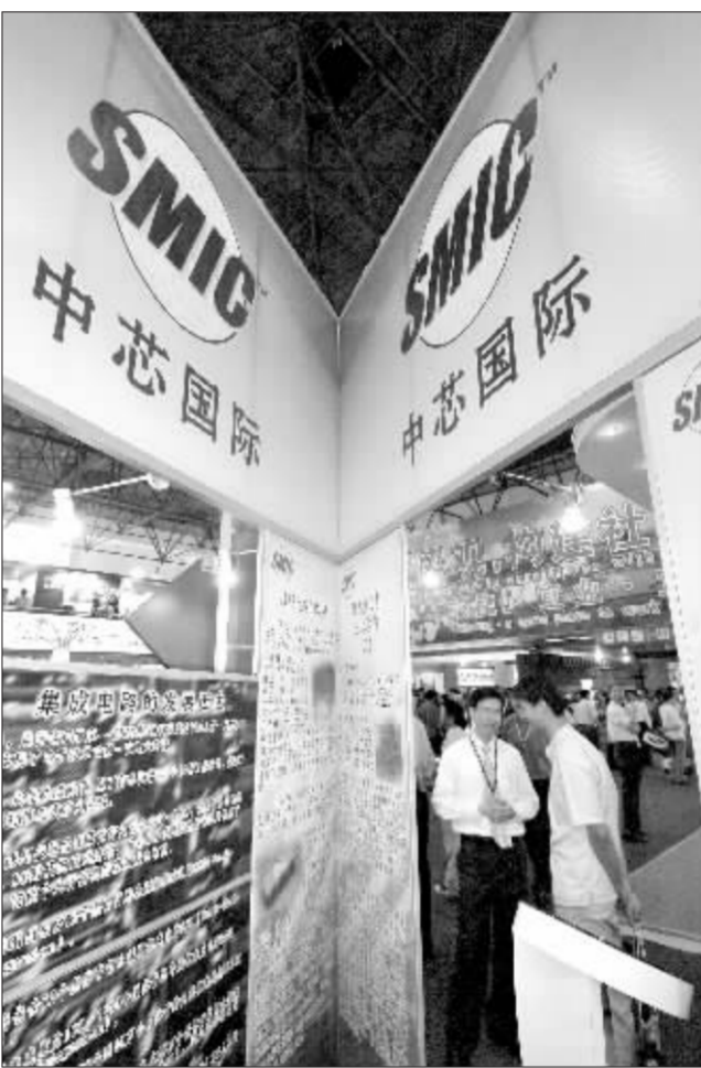
中芯国际称,具体索赔金额目前未有定论 资料图

资料显示,2003年12月,台湾半导体厂商台积电公司曾牵头向美国加州地方法院提交诉讼,称中芯国际公司侵犯了其多项专利并窃取了