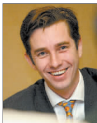
胡润及其团队编制的榜单开始将关注重点转向了中国上市公司 资料图

北京物美同时也位居《2006最有投资价值的民营企业》排行榜第一名,第100名是G鹏博士,其股价涨幅也达到100%。民营企业由于机制的灵活性、股票的流动性和接受海外资本的便宜性,使其受到很多投资者的青睐。榜上所涉及的行业主要有IT、化工、零售、房地产等,这些都是民营经济最为活跃的行业。