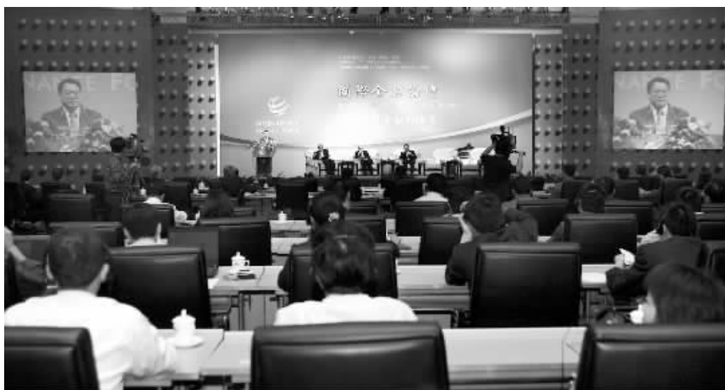
昨日,财政部副部长李勇在国际金融论坛第三届年会上发言

国务院发展研究中心金融所副所长巴曙松则认为,新的协调机构的定位,可以类似金融控股公司与子公司的关系。金融控股公司在总公司层面是多元化经营,但在子公司层面是分业经营,这样既能适应混业经营也能适应分业经营。