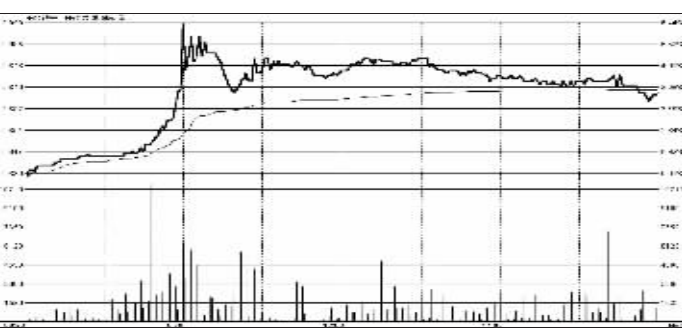
基金银丰昨日最大涨幅超过6% 张大伟 制图