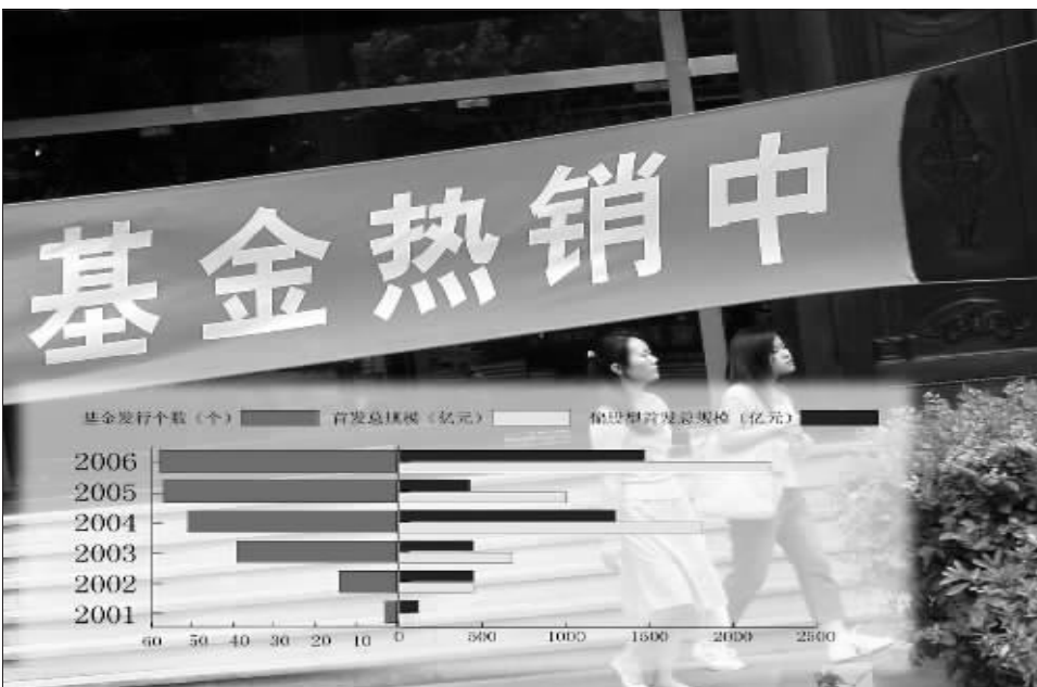
今年是基金发行有史以来最为红火的一年 徐汇 资料图 郭晨凯 制图

截至目前,已经成立的基金个数只比去年多了一只,但今年基金的发行结构却与去年相比却有质的不同。