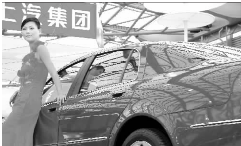
上汽将于10月上旬公布第一个国际化品牌名称 资料图

福特中国方面表示,这并非草率的决定。他们有两项购买理由。一是,Land Rover品牌和Rover源自同一品牌——Rover。二是,早在2000年福特汽车从宝马汽车手中购得Land Rover品牌(路