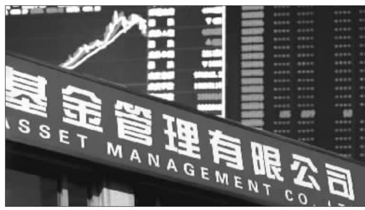
基金公司是否能投资股指期货要过四道关口 张大伟制图

亦有业内人士认为,基金作为市场的稳定因素,总体看来不应成为做空市场的力量,相对而言,一些保本基金通过购买股指期货锁定风险,恐怕更加合理。由此可见,并非所有基金都有必要投资股指期货。