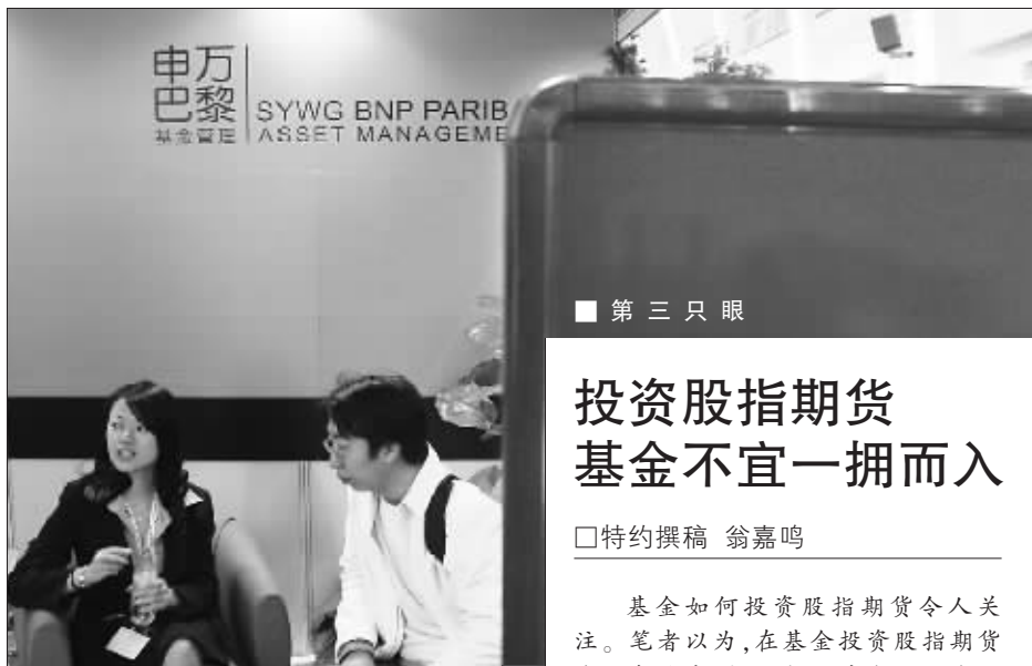
申万巴黎基金对股指期货充满兴趣 徐汇 资料图

沪深300股指期货的推出已经是箭在弦上。作为国内金融期货交易市场上的首个交易品种,沪深300股指期货的推出受到市场各方的高度关注。据记者了解,作为国内证券市场重要的机构投资者之一,不少基金公司正在全力以赴为尽快涉足股指期货交易进行各项准备。