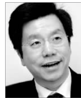
Google全球副总裁李开复