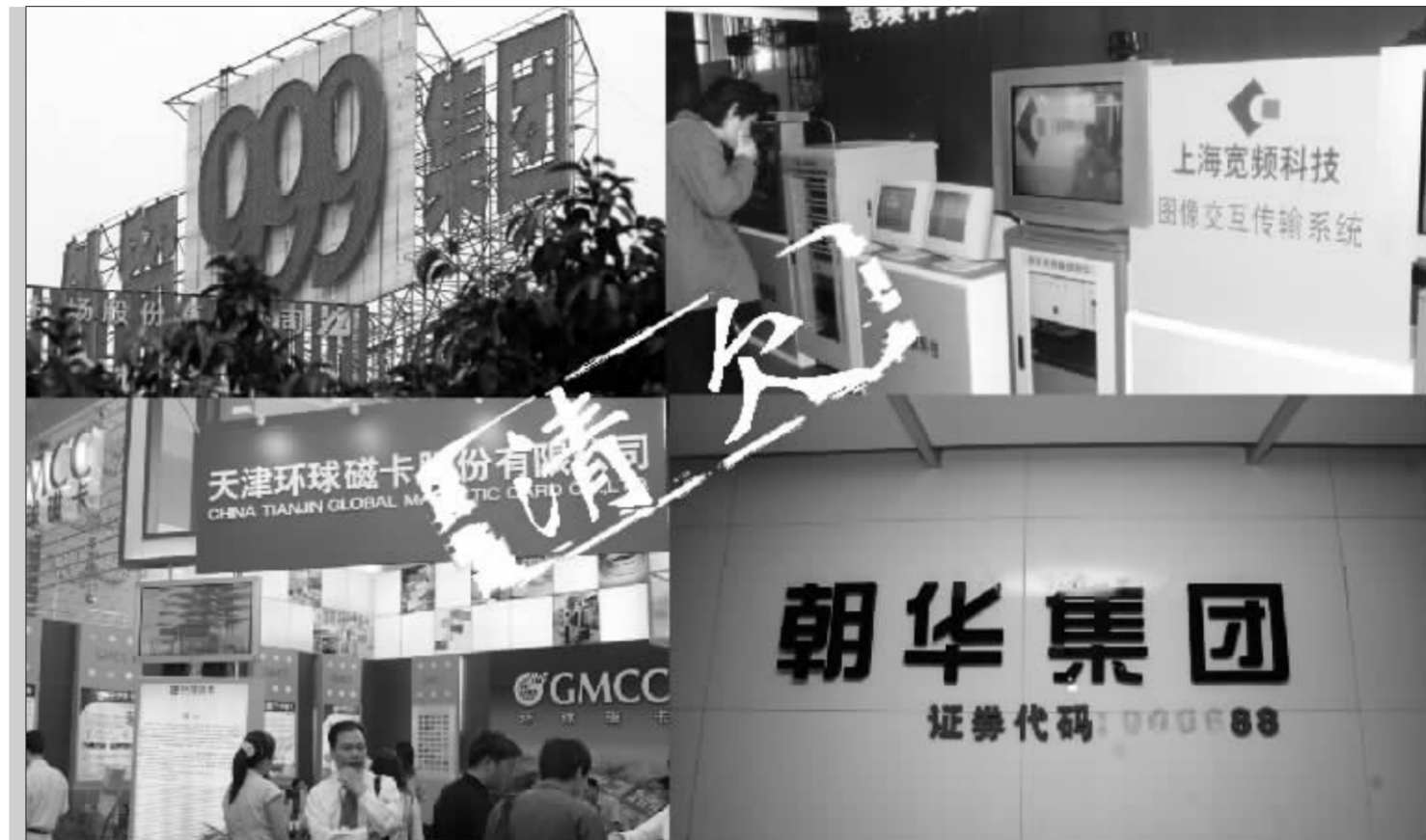
S*ST磁卡、S*ST朝华、S沪科技等上市公司仍存较大清欠压力 郭晨凯制图

比如,上市公司能否将应收账款按账面余额转让给资产管理公司,由专业机构帮助完成清收任务。还有少数公司已经对大股东占款全额计提了坏账准备,如果大股东确实不具备清偿能力,能否引入大股东破产机制,这样上市公司反而能获得一些清算资金,视为坏账转回,反而比长期挂账又无法清收有利。