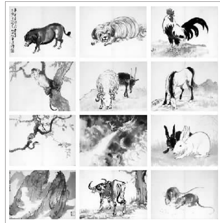
徐悲鸿十二生肖册页