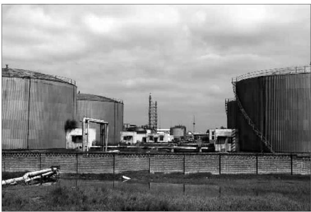
打了四年官司的大庆联谊投资者终将获得赔偿 资料图

2005年1月,胜诉投资者向法院提起了强制执行申请。同年4月,法院查封大庆联谊价值过千万的房产。原以为,只要通过拍卖查封资产,所得款项足以用来向投资者支付赔偿款。但因案外人提出执行异议,使得此案的执行又出波折,并