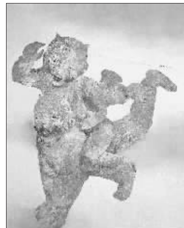
郭晋 Children playing