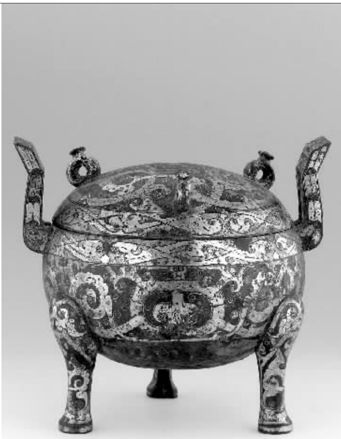
战国《错金银云纹鼎》

是一件西周中期《波曲纹壶》以426.6万元人民币成交,这件拍品拍卖之前的估价仅在80-100港元之间,可最终的成交价格却是最高估价的4.26倍。该曲纹壶的纹饰活泼多变,线条深邃,显示了西周中晚期青铜上乘的制作工艺,确实是一件精品。夺得本场“探花”位置的是估价最高的一件西周晚期《凤鸟尊》,(估价300-400港元)最终以341.3万元人民币成交。这件凤鸟尊的形制很特别,其整体为凤鸟形,但是头部却是龙首,实际上是龙凤的混合体,造型独特、奇异。因此该件凤鸟尊具有极高的收藏价值。此外有多件拍品都是以高价成交,明《铜鎏金多臂观音菩萨像》以329.1万元人民币成交;北朝《扇形兽纹刻石门楣》以243.8万元人民币成交;