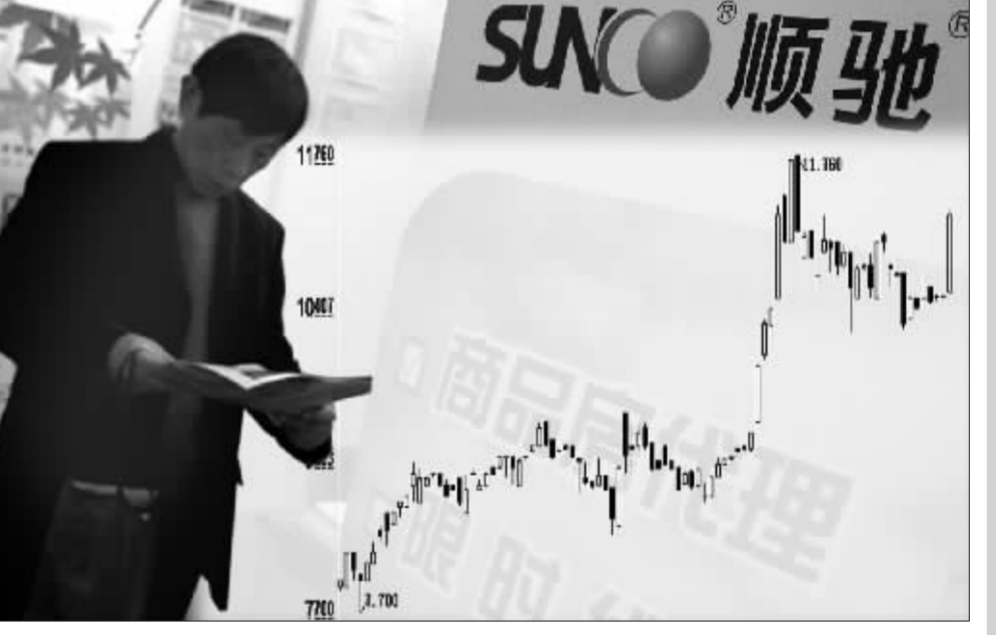
路劲基建近期走势强劲 张大伟制图

9 月初,路劲基建系高调宣布,以期权加贷款的组合方式向顺驰集团提供融资支持。其中涉及的三项期权包括:1、顺驰旗下物业凤凰城的购买期权,金额不超过 3.8 亿元。2、顺驰 A 公司 55% 股权的认购权,金额不超过 5 亿元。3、顺驰 B 公司 55% 股