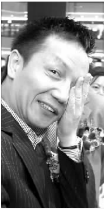
廉署仍未放弃对周正毅的司法诉讼