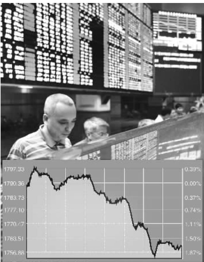
大盘再现黑色星期一 张大卫 制图