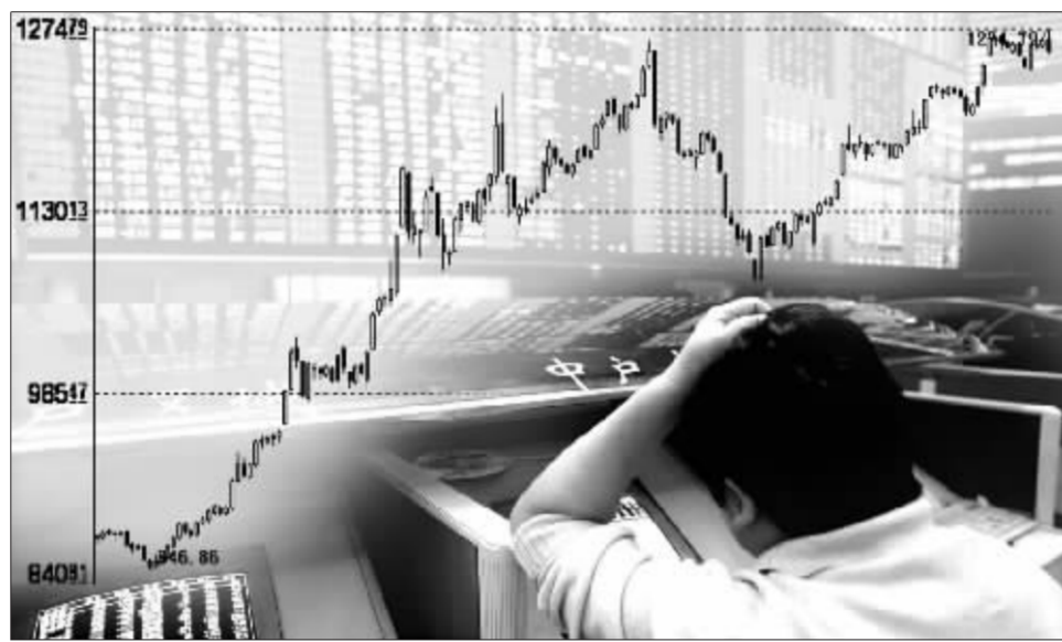
封闭式基金折价率的加大是否会给投资者带来又一次投资机会?