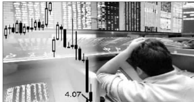
江苏吴中近日持续大跌 张大伟 制图

吴中半年度报告信息披露,该股东总户数13816户,流通A股股本28147.5万股,除非流通股外,流通股人均持股数高达2.038万股,筹码较为集中,有一定被庄家控盘的迹象。