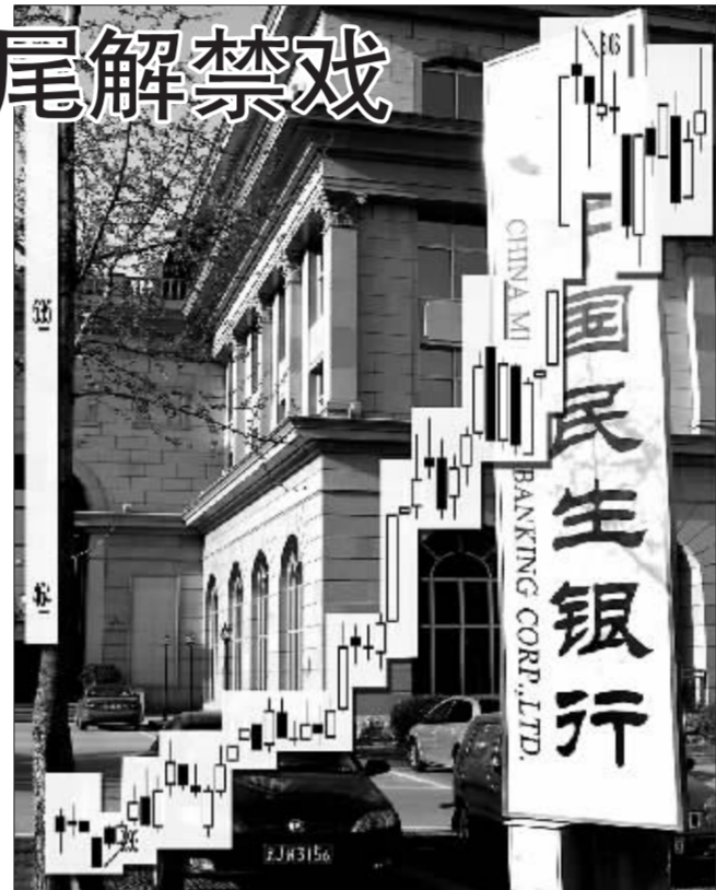
民生银行近期持续上涨 史丽 资料图 张大伟 制图

流通股上市,从理论上讲,截至今年年底,两市合计共有201家公司超过100亿股限售流通股解禁,对应市值也超过700亿元。但相对目前A股市场约1.5万亿元的流通市值,其占比只有5%左右。因此,平安证券李先明认为年内限售股上市对A股市场整体的冲击较为有限。