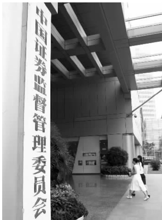
证监会在总结“查审分离”实践经验基础上,借鉴发达国家“行政法官”制度,结合我国具体情况推出了行政处罚新体制

新一届行政处罚委员会成立,7名资深监管人员专职处理行政案件,改变了以往行政处罚委员由各部门和各派出机构选任人员兼任的做法。中国证监会主席尚福林表示,此举是新形势下推进资本市场依法行政的重大举措