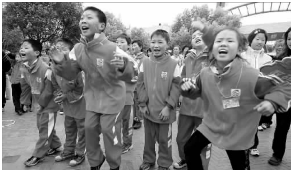
图为杭州青少年活动中心,民工子女在此免费参加快乐游艺活动 资料图

【对策】 近几年,各级政府采取了有力措施改善农民工的生产生活条件。政府应给他们提供一些设施较好的廉租房,加强对出租房屋管理,为务工经商的农民工租房提供房屋管理服务,以适当改善农民工居住条件。要坚持依法维权,发挥工会作用,提高农民工素质,强化政府职能。