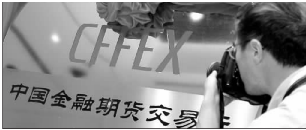
中国金融期货交易所 徐汇 资料图

测试的界面使用的只是明细报价单,由于目前还没有确定信息提供者,因此不能给投资者提供更为直观的走势图。另一些会员则表示,由于自己公司的柜台系统不够稳定,目前在几个系统(如:金仕达、恒生、富远等)之间进行测试,因此暂时还不能接纳客户。