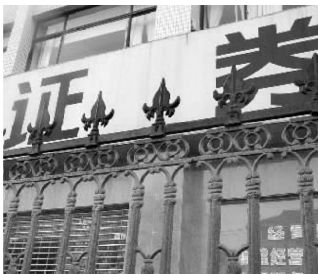
证券犯罪追诉标准的制定,将为严惩有关犯罪行为提供具体明确的操作规范 资料图

他表示,新《公司法》解释的是分专题进行研究制定的,目前已经初步考虑成熟或者相对较为成熟的专题包括有关公司出资、设立、股权转让、股东代表诉讼、公司清算和解散等内容,这些问题可能会在随后出台的两个《公司法》解释中予以规定。而由于缺乏更多的实践经验,《证券法》的司法解释制定进程相对来说步伐要慢一些。