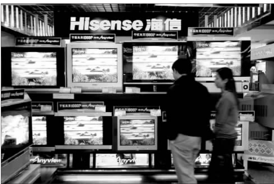
中国品牌的平板电视已经占到市场 80% 以上 资料图

25.23%;实现净利润 5015.36 万元,同比增长 169.96%。前三季度,厦华电子累计销售彩电 256 万台,较去年同期增长 18.28%,其中平板电视销售量同比增长 60%。