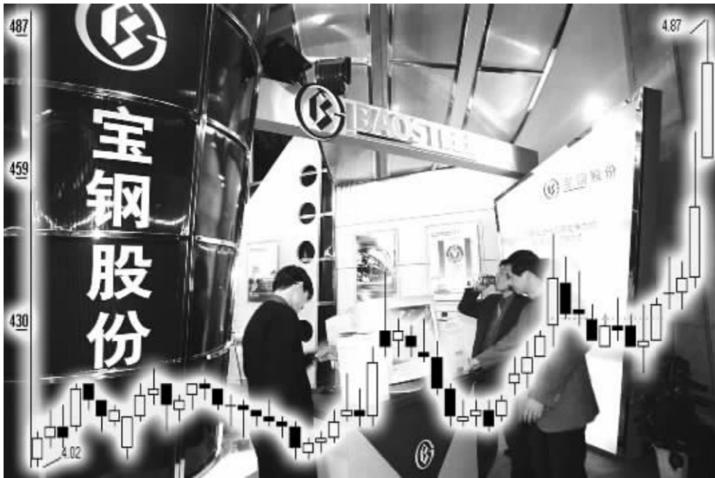
绩优钢铁股开始领涨 徐汇资料图 张大伟制图

钢铁股近阶段的强劲表现,与钢铁股普遍低估值形成的“洼地效应”有关。资料显示,在本轮长达一年多的牛市中,钢铁板块表现一直较为滞后,部分品种长期处于底部。但从牛市的运行规律来看,板块轮动几乎是永恒的特征,因此,钢铁股长期没表现,似乎正预示着投资机会所在。在部分钢厂