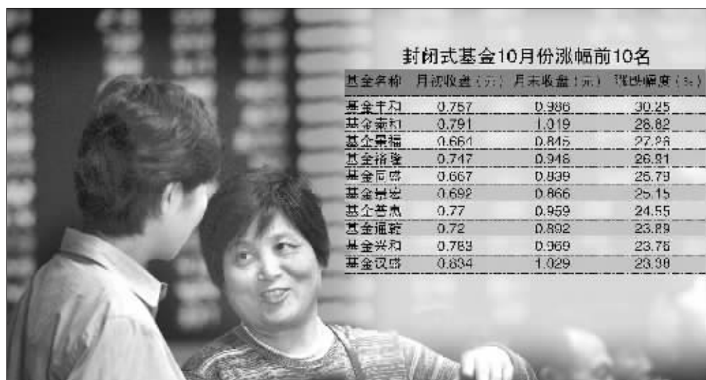
近来,封闭式基金的走势备受市场关注 史丽 资料图 张大伟 制图

连日来投资者对封闭式基金的热切关注令其成交大幅放量,到10月末的这天达到近期成交额高峰。当日53只基金共成交21.36亿元,较上一交易日宽幅放大76.20%,大、小规模封闭式基金的成交额分别增加70.46%和131.67%。单只基金中,汉兴成交额达到2.12亿元,位居成交冠军,且换手率达到9.41%的高点,在与当日封闭式基金2.08%的平均换手率对比中,再次彰显了投资者对汉兴的偏爱。此外,景福、同德和通乾的成交额亦超过亿元大关。