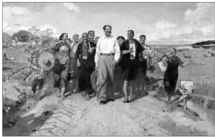
陈衍宁《毛主席视察广东农村》

于国内买家和欧美一些国家艺术机构的积极介入和近期国内学术界相关讨论会的连续推出,此类红色经典系列油画市场依旧十分活跃,如在中国嘉德亮相的艾文有、于牧的《建立一个强大的海军》以275万成交,招炽挺、赵淑钦、王孝柏的《井冈山进军》以286万元成交,比去年有了较大的涨幅,而2004年同类作品的最高成交价只有全山石的《中华儿女——八女投江》创下的170.5万元。到秋季,各大拍卖公司由于注意到该板块特殊的历史意义和代表性的艺术水准,遂顺势而上,拍上了大量具有